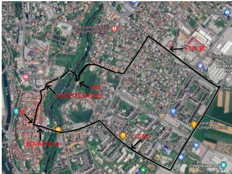
Slika 1: Potek poti "Kr` zelena misija" (podlaga: Google Zemljevidi)

Na lokaciji postanka na se nahajajo QR kode. To udeleženec poskenira s pametnim telefonom in si ogleda videoposnetek. V njem izve glavne značilnosti lokacije, kjer se nahaja. Poleg tega izve tudi črko za končno geslo in dobi navodila do naslednjega postanka.