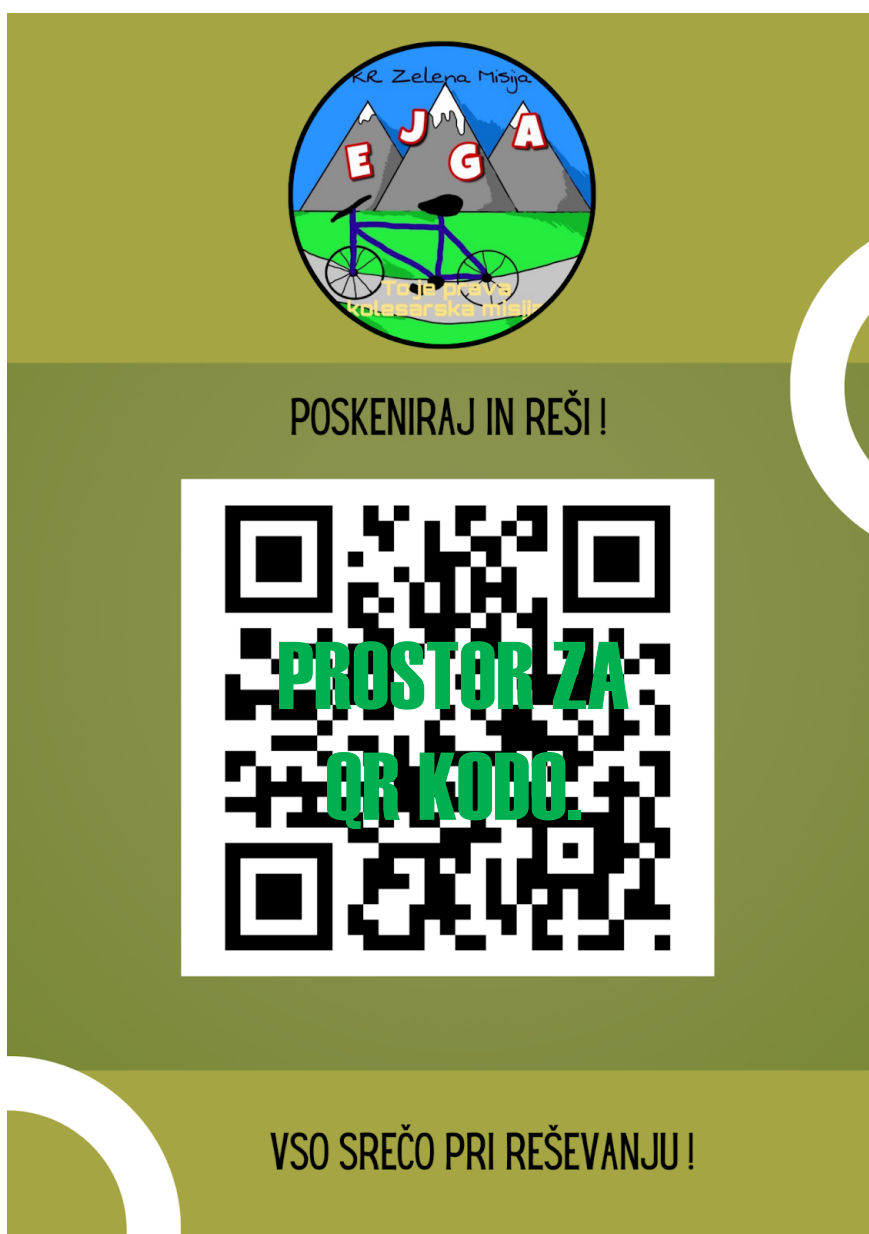
Slika 2: Nalepka s QR kodo na postojankah

V spodnjih točkah je navedeno besedilo, ki je slišano v videoposnetku pri posamezni točki.