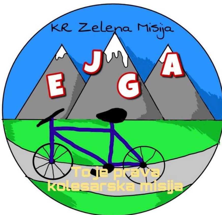
Slika 5: Logotip "Kr`zelena misija"

V logotipu je tudi ime kolesarske poti in moto te poti. Oblikovala ga je učenka Ana Vodnik.