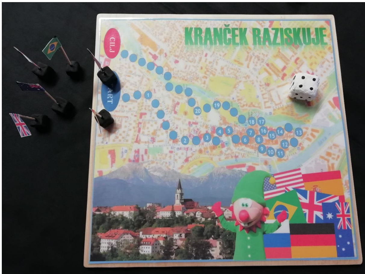
Figurice, podlaga in kocka za igro Kranček raziskuje.

Cilj igre je biti igralec, ki na cilju doseže največ točk. Družabna igra je namenjena igralcem s starostjo nad 11 let in omogoča vključitev največ sedmih igralcev oz. najmanj dveh igralcev.