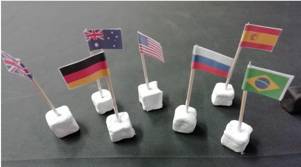
Figurice za namizno igro Kranopoly.

Kranopoly je dinamična in poučna igra, ki jo lahko igrajo 2 - 4 igralci. Igra nas uči o Kranjskih znamenitostih in spodbuja ljubezen otrok do kulturne dediščine. Za igro potrebujemo 4 različne figure in 2 kocki.