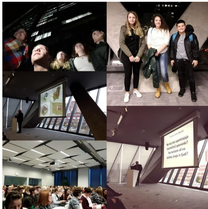
Naš obisk strokovnega posveta v Ljubljani.

V mesecu novembru smo se predstavniki posamezne skupine in mentorja udeležili strokovnega posveta v Kristalni palači v Ljubljani. Pridobljene informacije smo učenci na naslednjem srečanju poročali preostalim učencem.